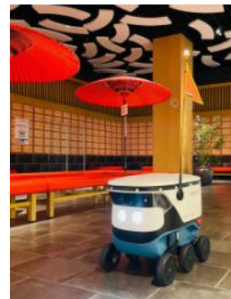
イオンモール常滑での配送イメージ 【写真左】アイシン社製ロボット「TCRBO1」 【写真右】Cartken社製ロボット